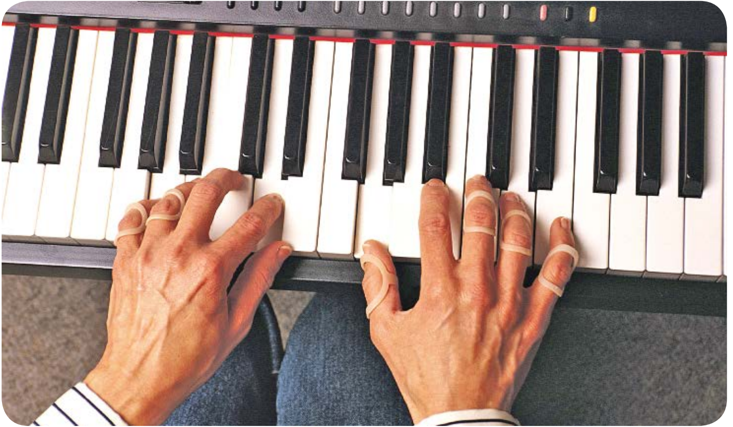
Oval 8-fingerring är lätt att anpassa, lätt att bära utan inskränkande funktion och håller många år.